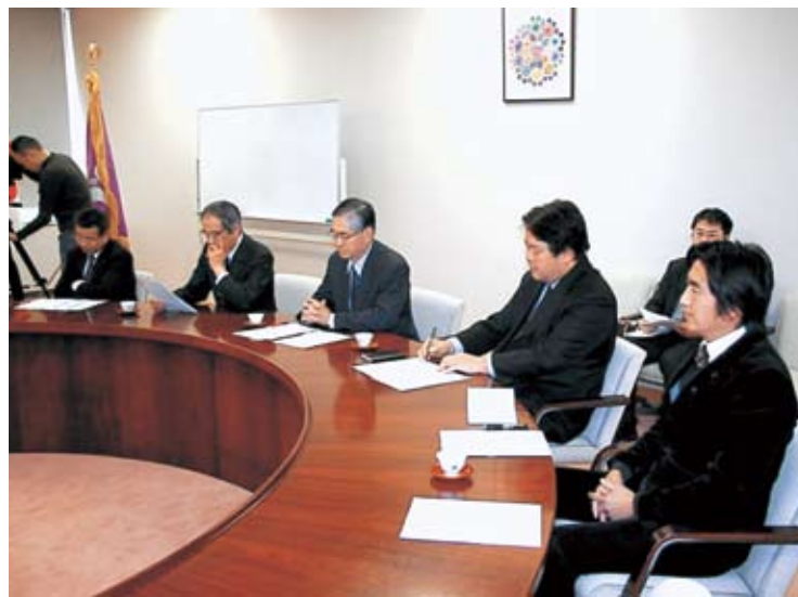
連合群馬と協力県議団が「低所得者、失業者等の就労・生活支援の充実を求める要請書」を提出