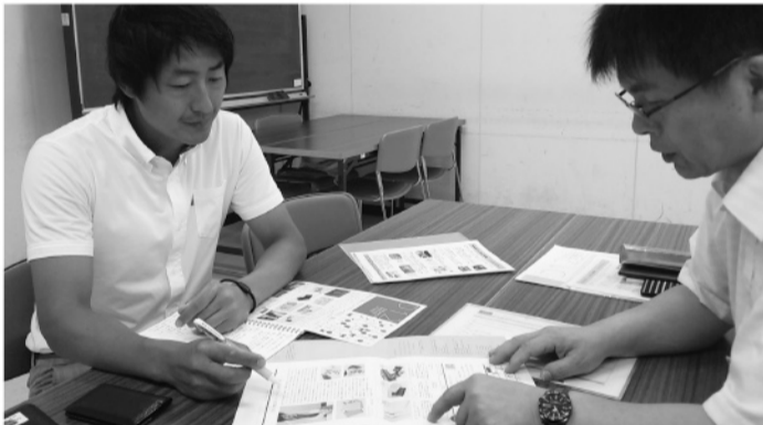
福岡県の「デザインアワード」の取り組みを調査。