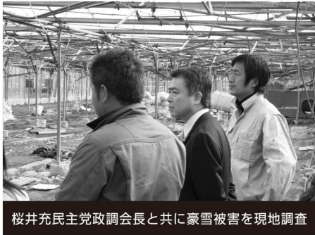
桜井充民主党政調会長と共に豪雪被害を現地調査