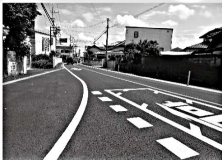
環状線「下小島西」交差点から北に行く県道の歩道の改良工事に着手。長年の懸案事項が前進