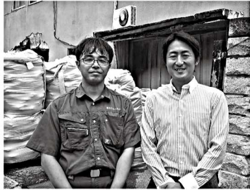
原材料高を逆手に！ペットボトルキャップなどから再生原料を生産する企業を訪問調査。