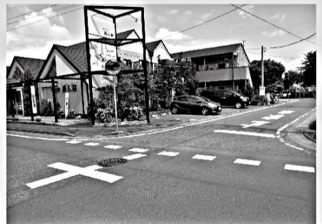
環状線「とりせん」の交差点を北に進んだ「異人館」横の交差点で事故が多発するため、「止まれ」表示の引き直し・強調を行った。