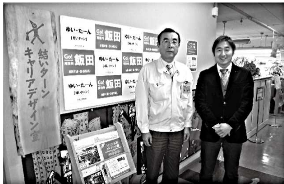
H24年度一般質問にて、長野県飯田市の「結いターン事業(※)」をもとに若者流出防止策を提言。「Gターン事業」という形で群馬でも取り組みが本格化！