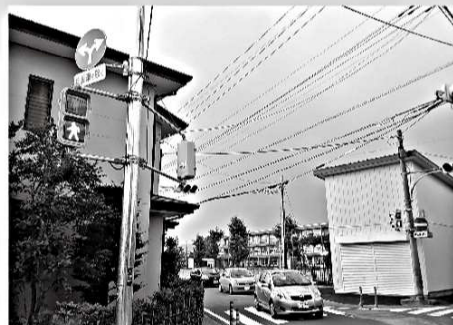
六郷小学校前東側交差点に歩行者用信号を設置。子ども達の安全を確保。