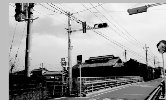
井野川サイクリングロード中川橋に押ボタン式信号を設置