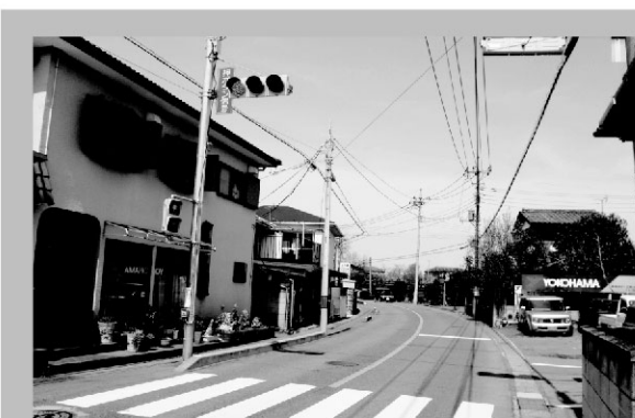
中川公民館東側の交差点に押ボタン式信号を設置

また、子どもの食育を起点に、親や地域の大人も巻き込み、市を挙げて食育に取り組んでいるのも共通の特徴です。小浜市は「食のまちづくり」を掲げ、市を挙げて地域の食資源を活かした活性化策を進めています。群馬県も農業県として豊富な地域資源を活かした「食の人づくり」を進めるべきであり、今後も研究を深め提言していく所存です。