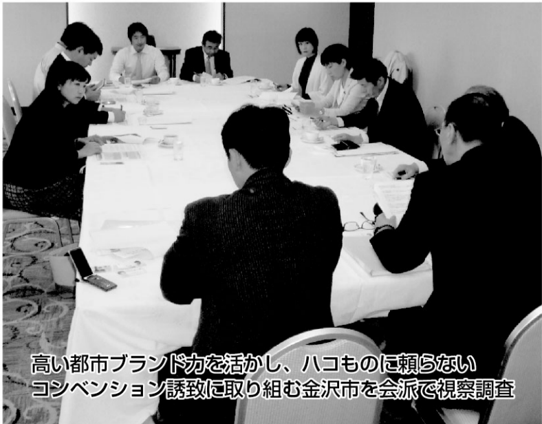
高い都市ブランド力を活かし、ハコものに頼らない コンベンション誘致に取り組む金沢市を会派で視察調査

知事の予算案に対し、こういった修正案が各会派から「当たり前」に提出され、議論を経てどんどん県民目線で修正して良い予算にしていく。そんな議会本来の役割を果たすために、リベラル群馬は果敢に問題提起を続ける所存です。