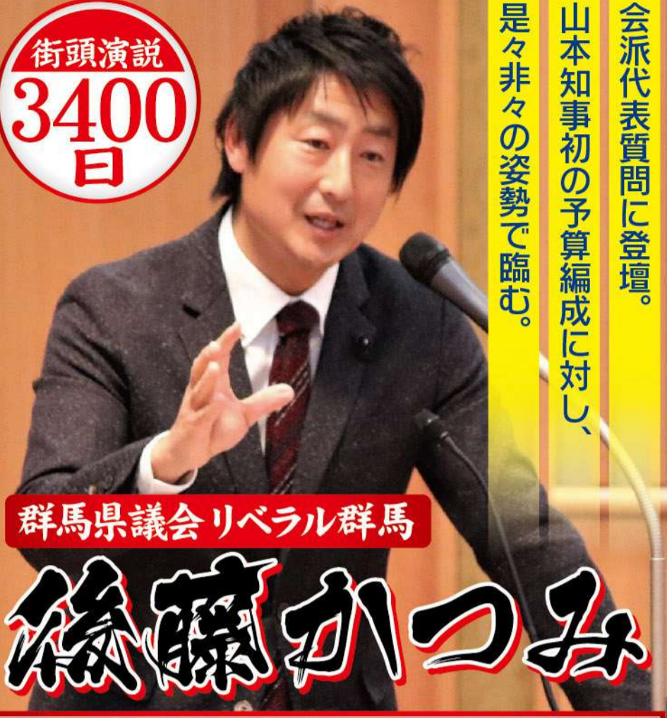
会派代表質問に登壇。 山本知事初の予算編成に対し、 是々非々の姿勢で臨む。