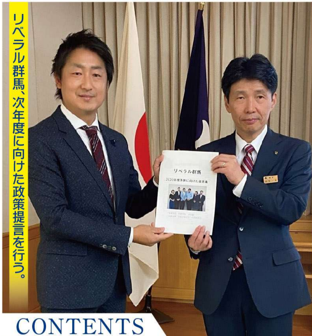
リベラル群馬、次年度に向けた政策提言を行う。