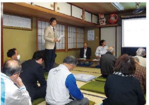
平成25年に行われた地元説明会の様子