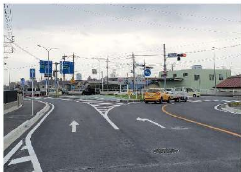
これまでの朝の深刻な渋滞が嘘のように改善！

豊岡地区最大の懸案の一つであった国道406号の渋滞対策。区長会や地権者の皆様などの協力により、無事完了しました。